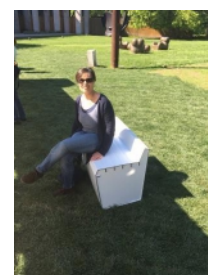
Fashion Design week in Milano, Italy. April 2017